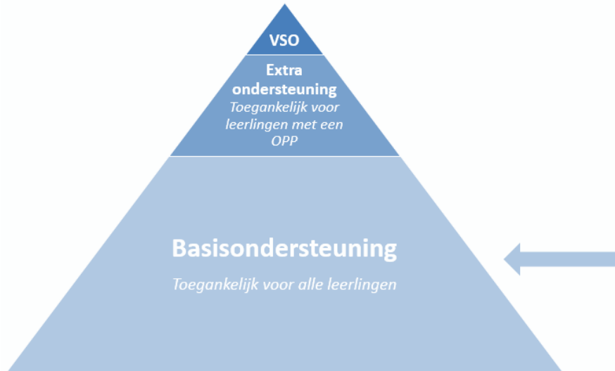
Figuur 1. Ondersteuningsdriehoek Basisondersteuning

Basisondersteuning is de ondersteuning die wij aan alle leerlingen bieden, zodat zij onderwijs op hun eigen niveau kunnen volgen. Alle scholen in ons samenwerkingsverband bieden basisondersteuning. In de ondersteuningsdriehoek hieronder wordt de basisondersteuning geïllustreerd als de onderste laag.