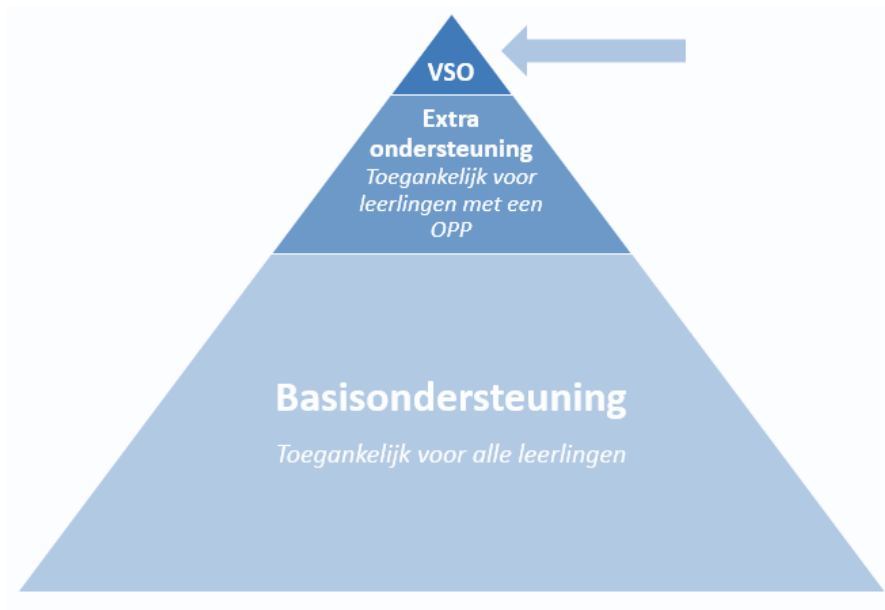
Figuur 4. Ondersteuningsdriehoek VSO

De bovenste laag in de onderstaande piramide illustreert dit.