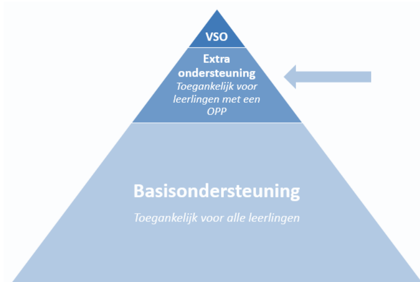
Figuur 3. Ondersteuningsdriehoek extra ondersteuning

In dit hoofdstuk omschrijven wij welke extra ondersteuningsmogelijkheden wij bieden. Deze ondersteuning gaat verder dan onze basisondersteuning. In onderstaande piramide wordt dit aangegeven als het middelste deel.