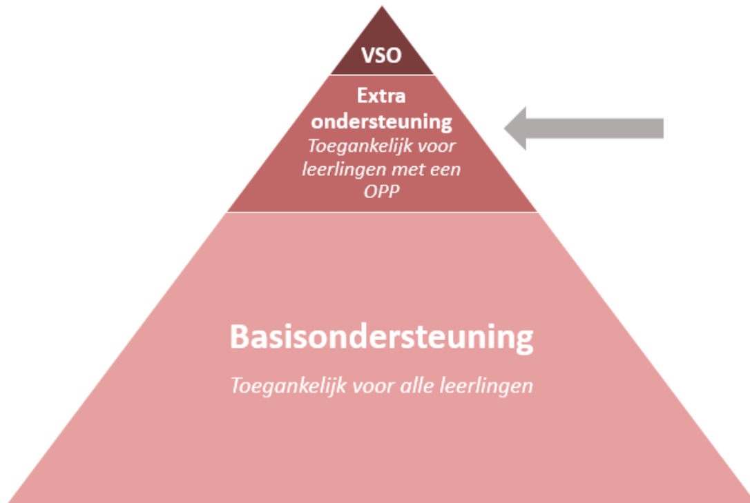
Figuur 3. Ondersteuningsdriehoek extra ondersteuning

In dit hoofdstuk omschrijven wij welke extra ondersteuningsmogelijkheden wij bieden. Deze ondersteuning gaat verder dan onze basisondersteuning. In onderstaande piramide wordt dit aangegeven als het middelste deel.