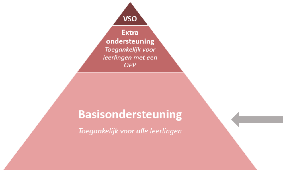
Figuur 1. Ondersteuningsdriehoek Basisondersteuning

Basisondersteuning is de ondersteuning die wij aan alle leerlingen bieden, zodat zij onderwijs op hun eigen niveau kunnen volgen. Alle scholen in ons samenwerkingsverband bieden basisondersteuning. In de ondersteuningsdriehoek hieronder wordt de basisondersteuning geïllustreerd als de onderste laag.